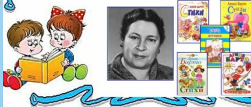
Агния Львовна Барто